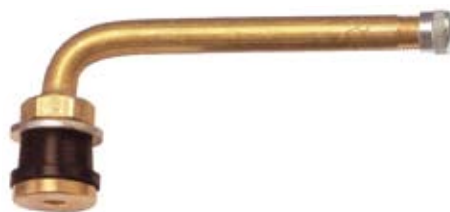
562 6764/ 562 9730